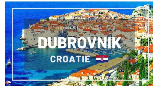
Dubrovnik ( Croatie )

Galerija Dučić Masle Pulitika, Poljana Marina Držića 1, 20000, Dubrovnik, Croatie